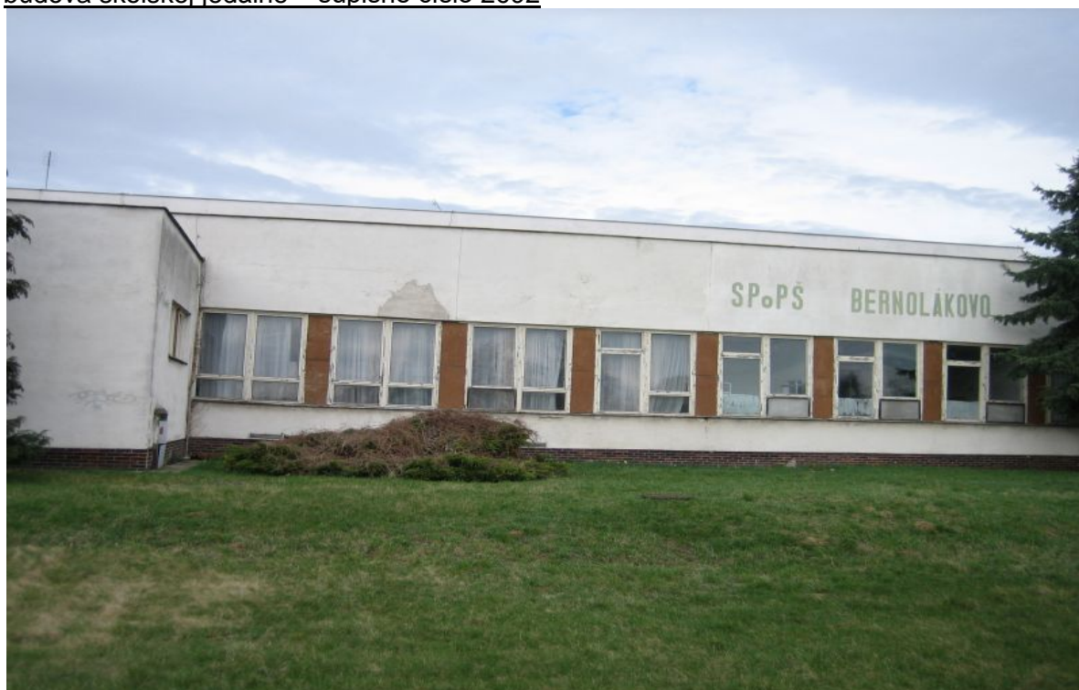
areál Veľké Blahovo technicko-administratívna budova bez súpis.čísła