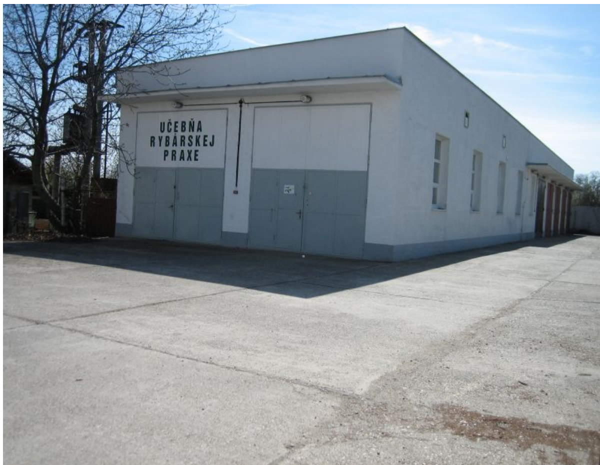
spoločenská miestnosť – súpisné číslo 1811