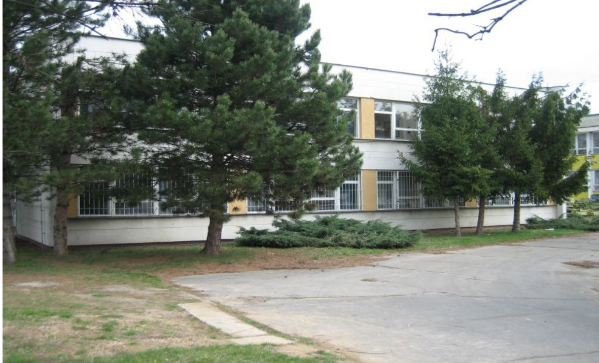
odborný pavilón – súpisné číslo 2691