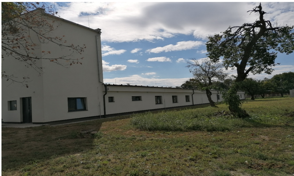
SO 01 - odborná učebňa – súpisné číslo 1860,