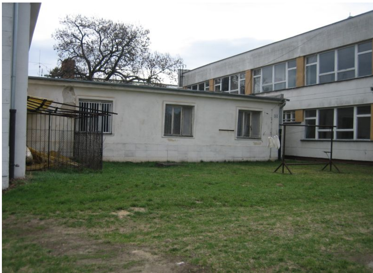
budova školského internátu – súpisné číslo 1685