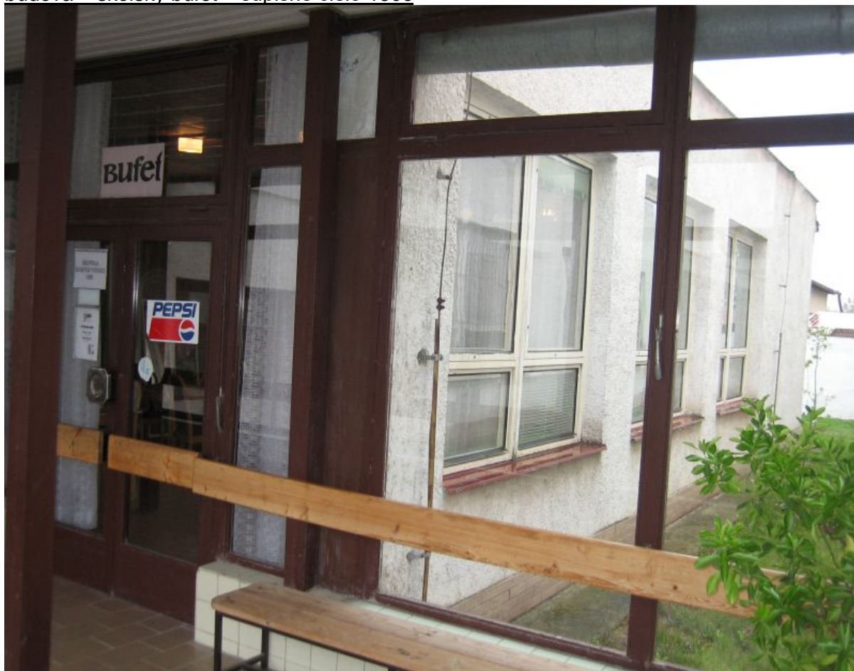
spojovacia chodba – súpisné číslo 1804