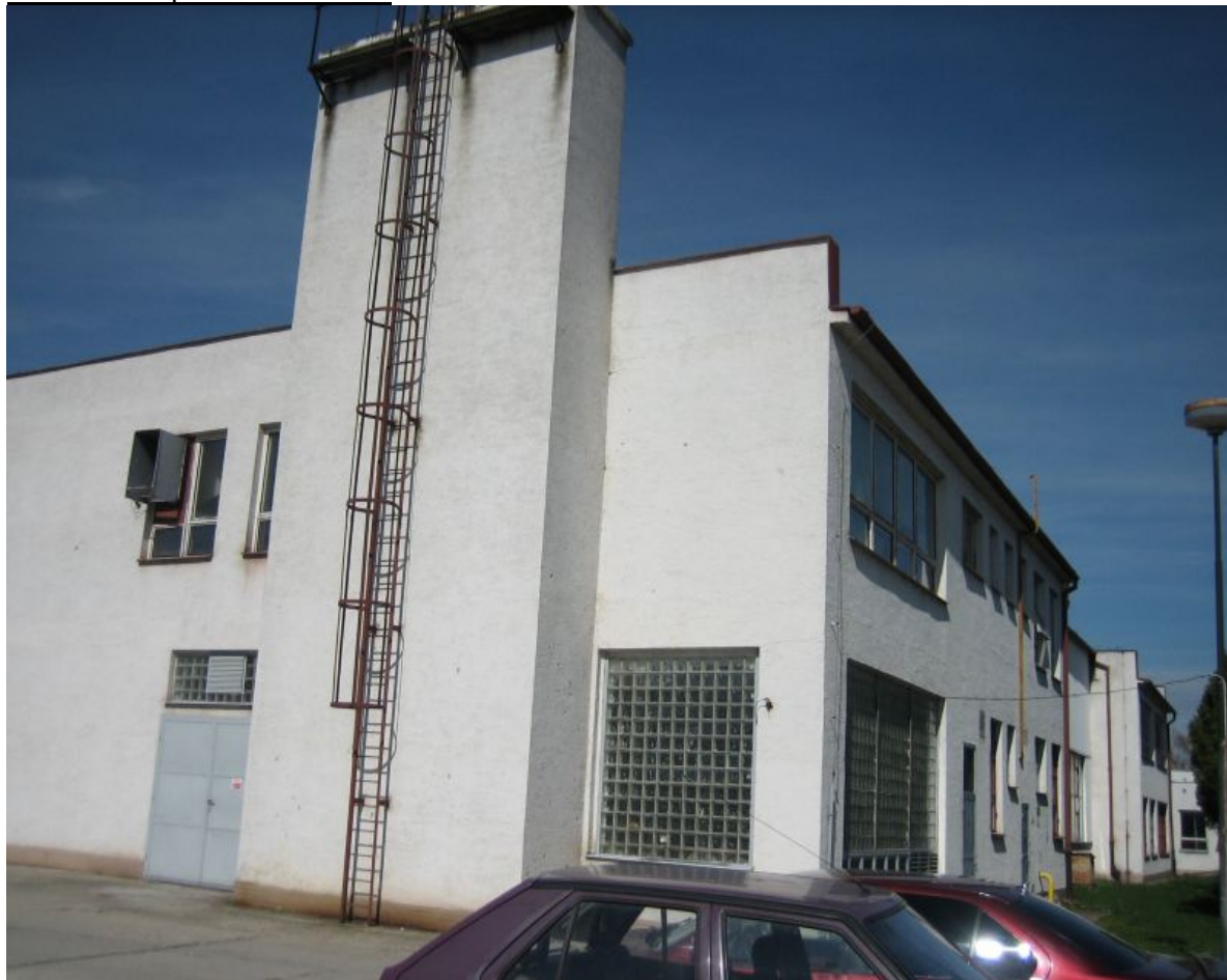
odborná učebňa – súpisné číslo 1808