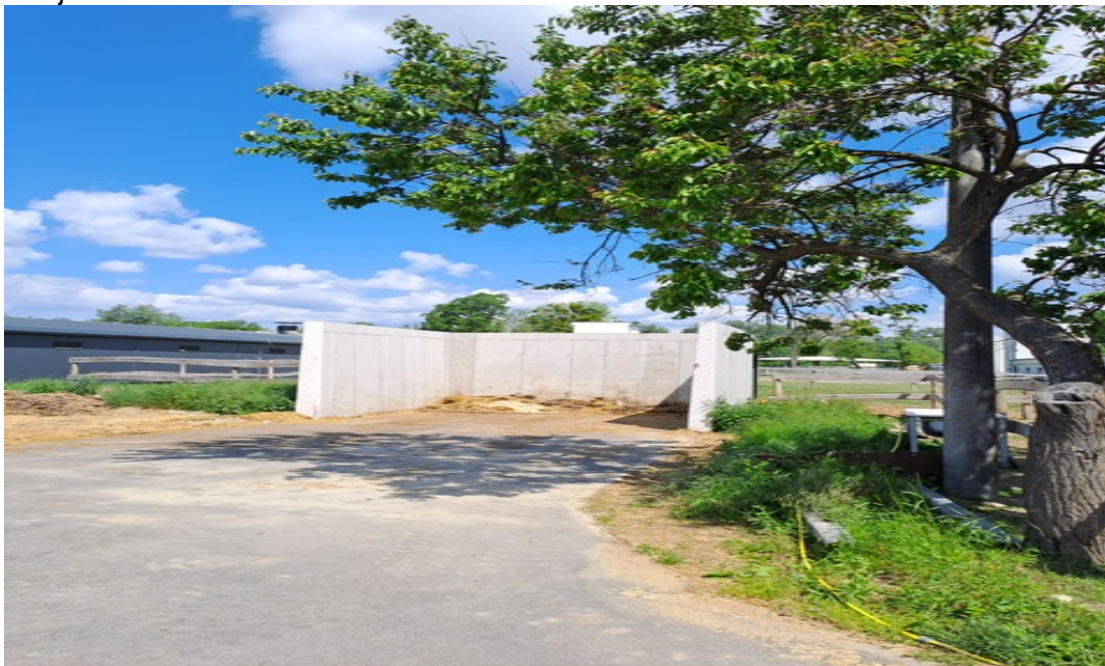
Prístrešok, bez.súp.č. na parc.č.914/28