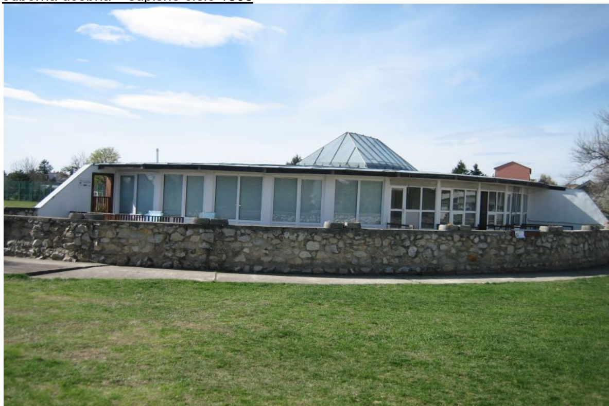
odborná učebňa – súpisné číslo 1809