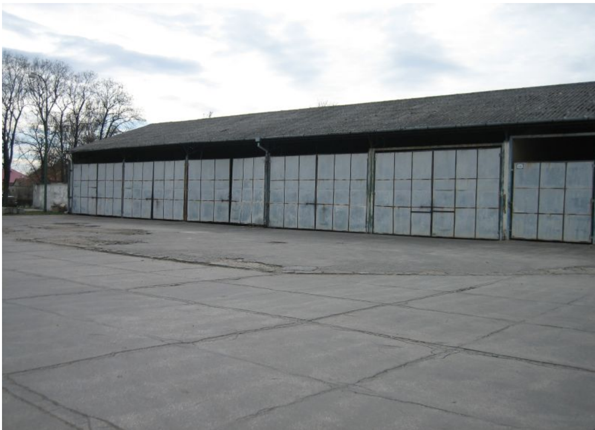
školské dielne – súpisné číslo 2690