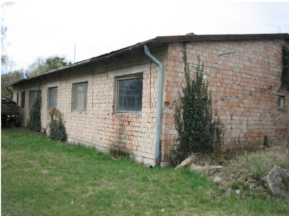
vodáreň – súpisné číslo 2683