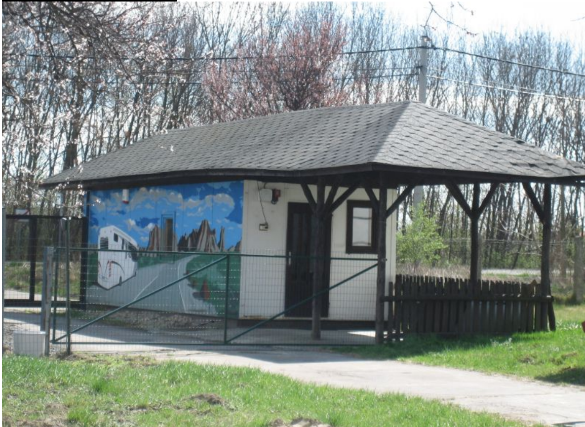
SO 10-skladovanie objemových krmív a stelív – súpisné číslo 1869, par.č.914/15